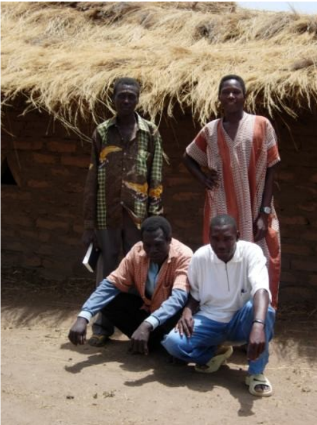
Illustration 1: Les responsables de l'église devant celle-ci: le pasteur, l'ancien, le diacre et le moniteur de l'école du dimanche

Notre jeune église mène depuis 2000 ses activités missionnaires dans le petit village rural de Hélibongo, dans une zone encore peu christianisée, située de l'autre côté du fleuve Chari, à une vingtaine de kilomètre de la ville de Sarh, au Sud du Tchad. Elle compte actuellement 24 membres et 30 enfants qui suivent l'école du dimanche.