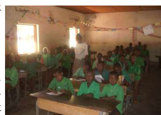
Elèves de l'école Saint François

La deuxième caractéristique précise que l'enseignement donné dans les ECA suit bel et bien le programme officiel du ministère de l'éducation nationale.