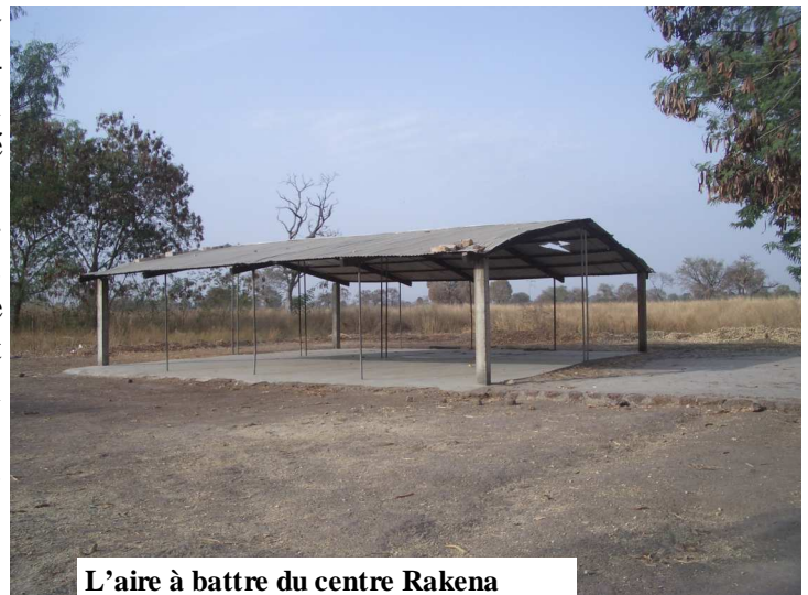
L'aire à battre du centre Rakena

En plus des habitats construits sur le modèle africain pour les couples, il y a d'autres jolis bâtiments servant de salle de réunion, de lecture et de dortoir. Il y a aussi un jardin d'enfants et une crèche.