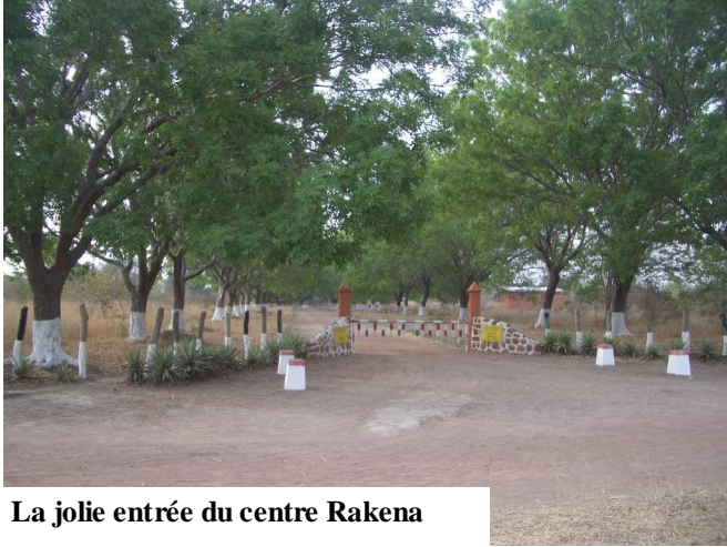
La jolie entrée du centre Rakena

Créé en 1964, le centre Rakena est actuellement un centre de référence dans la sous-préfecture de Danamadji sinon dans tout le département de la Grande Sido. Large de 2 km et long de 3 km, Rakena est cultivable que sur 100 hectares. 30 hectares sont cultivés cette année dont 10 hectares d'arachide, 10 de sorgho et 10 de maïs. Chaque couple (l'homme et sa femme) a droit à 2 hectares pour cultiver. 68 hectares sont mis en jachère. Le reste est réservé pour le reboisement qui a commencé depuis plusieurs années faisant de Rakena une véritable préservation de la flore et des faunes. D'ailleurs, l'un des objectifs assignés à ce centre est la protection de l'environnement. Le premier objectif est la formation spirituelle des couples catéchistes pour la consolidation de la parole de Dieu. Mais, en plus de cette vocation spirituelle, les couples qui y entrent bénéficient d'autres formations sur les techniques d'agriculture et d'élevage modernes, d'animation en milieu rural, de transformation des produits locaux. Ils reçoivent aussi quelques notions sur la santé pour lutter contre l'excision, le Sida.