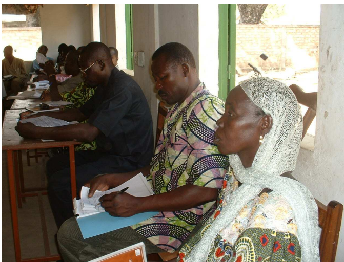
Participants à l'atelier de formation sur le PDR