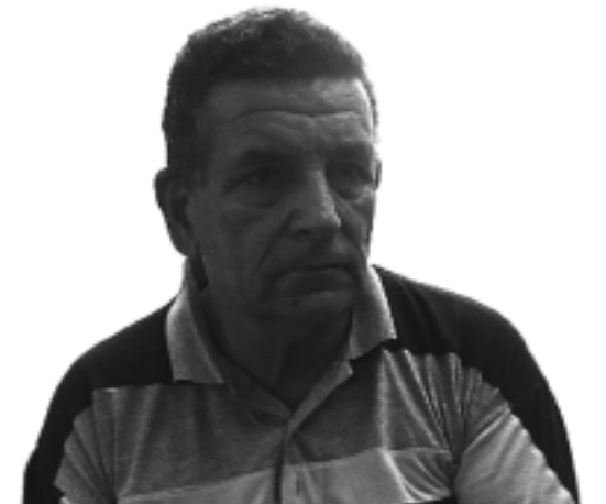
TCHANGUIZ VATANKHAH / Ph. ST