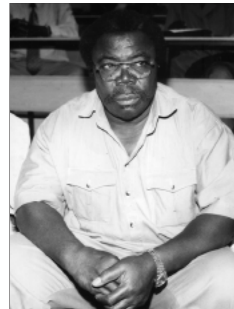
Sarh TRIBUNE : La ville de SARH a été retenue pour la première Compétition interrégionale. Pourquoi ce choix ?

Propos recueillis par YANLOMTOLOUM Ngabou et NDANGUIRA Valéry.